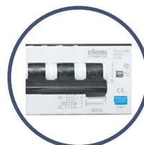
QUADRO con magnetotermico differenziale

Distribuito in esclusiva da: Prai s.r.l. Gravina in Puglia (BA)/Italy, 70024, via Nobel, 15/17 tel.: +39 080 325 58 17