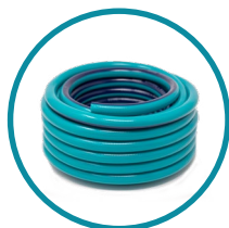
TUBO ACQUA ALTA PRESSIONE - 100 mt