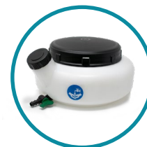
CISTERNA LAVAMANI 7lt