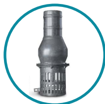
FILTRO/VALVOLA DI FONDO