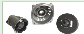
SUPPORTO MOTORE SCOMPONIBILE • Doppio cuscinetto • Antivibrante in gomma sovradimensionato