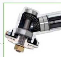
COPPIA CONICA CON 4 CUSCINETTI • Riduce l'usura • Alto rendimento

Distribuito in esclusiva da: Prai s.r.l. Gravina in Puglia (BA)/Italy, 70024, via Nobel, 15/17 tel.: +39 080 325 58 17