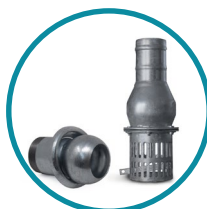
GIUNTO FILETTATO + VALVOLA ZINCATO

Distribuito in esclusiva da: Prai s.r.l. Gravina in Puglia (BA)/Italy, 70024, via Nobel, 15/17 tel.: +39 080 325 58 17