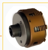
Frizione multidisco in bagno d'olio