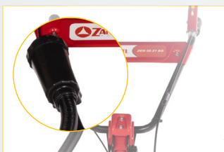
FILTRO ARIA 2 stadi SNORKEL